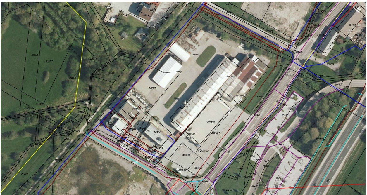
Slika 3: Gospodarska javna infrastruktura (rumena linija – plinovodno omrežje; temno rdeča linija – kanalizacijsko omrežje sanitarnih odpadnih voda; rdeča linija – elektroenergetsko omrežje; temno modra linija – vodovodno omrežje; svetlo modra linija – omrežje padavinskih odpadnih voda; temno vijola linija – javna razsvetljava; oranžna linija – TK omrežje; iObčina, januar 2022).

Na območju SD OPPN je urejeno javno vodovodno omrežje, kanalizacijsko omrežje sanitarnih in padavinskih odpadnih voda, elektroenergetsko in TK omrežje, plinovodno omrežje in javna razsvetljava.